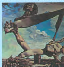
4. S.Dali, Το ατελείωτο αίνιγμα, 1938