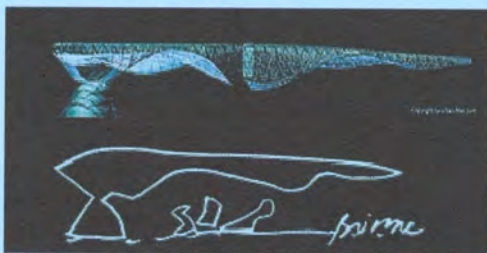
1. Coop Himmelb(l)au BMW Welt, Munich, International competition 2001

"Όσο περισσότερο εξηγώ τόσο περισσότερα βλέπω. Πιστεύω ότι το ζήτημα της εξήγησης μας δίνει τη δυνατότητα να δούμε περισσότερα, να αυξήσουμε ικανότητες και αντίληψη, να