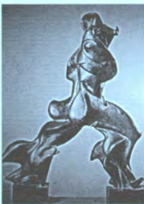
5. U.Boccioni, Μοναδικές φόρμες συνέχεις στο χώρο, 1913

Οι τεχνικές και ο πολιτισμός αναπτύσσονται ταυτόχρονα με προφανή αντίκτυπο στην αρχιτεκτονική. Τα ψηφιακά εργαλεία στην αρχιτεκτονική άρχισαν να χρησιμοποιούνται στην αρχή απλώς για παραγωγή σχεδίων, μετά για αναπαράσταση, και τώρα για μορφοποίηση και για απόδοση "υλικότητας" στη μορφή. [εικ. 06] Από τη χειρονομία του δημιουργού αρχιτέκτονα, η