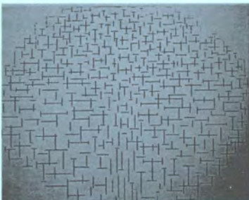
6. Mondrian αποβάθρα και ωκεανός 1915 / Michael Noll "Computer Composition With Lines" 1964